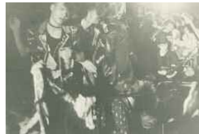
Laco Garaj, triptych obrazů Pták Hadilov

poslal a k další její skladbě dokonce natáčí televize videoklip) a že jsou v té době všeobecně poměry o něco svobodnější, ovšem neznamená, že by v různých končinách Československa aktivita represivních orgánů výrazněji polevila: „Proti vousatým a vlasatým rockerům dřívějších let musí připadat estébákům rozčuchaný, zmalovaný, sichrhajckama prošpikovaný a provokativně se chovající punk jako ztělesnění kontrarevoluce. Pro ty chytřejší a méně paranoidní fízly je punk zase vhodným objektem k tomu, aby se protokoly zaplňovaly hlášeními a mohla se vykazovat nahoru intenzivní činnost při ochraně socialismu. Punkové jsou většinou dost mladí, nezkušení, při výslechu toho spoustu nažvaněj, a tak se může fízl z „proti-punkového komanda“ celkem snadno dočkat povýšení a vyššího platu.“ (Mikoláš Chadima, Vokno č. 14, Praha 1988) Na ulici tak pankáči nadále patří kvůli svému provokativnímu zjevu k oblíbeným objektům policejní buzerace, koncerty se v lepším případě odehrávají za přítomnosti zvědavých tajných, v horším jsou zakázány předem