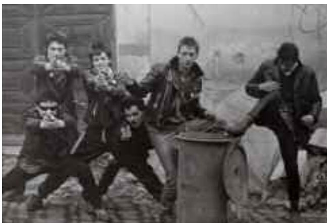
Laco Garaj, triptych obrazů Pták Hadilov

zámek, V3S nebo Plexis. Mimo Prahu se začíná hrát punk v Teplicích (Čtvrtá cenová skupina/F. P. B.), v Liberci (Hubert Macháně), v Plzni (Zastávka Mileč), v Havířově (IQ 60) nebo v Bratislavě (Extip, Paradox). Koncertuje se většinou pololegálně – některé kapely (Visací zámek, F. P. B.) mají zřizovatele a daří se jim vyhýbat se větším průšvihům, jiné se o legalizaci svého hraní ani nepokoušejí (pochopitelně – například s názvem kapely Suchý mozky by to šlo jen těžko) a vystupují většinou načerno,